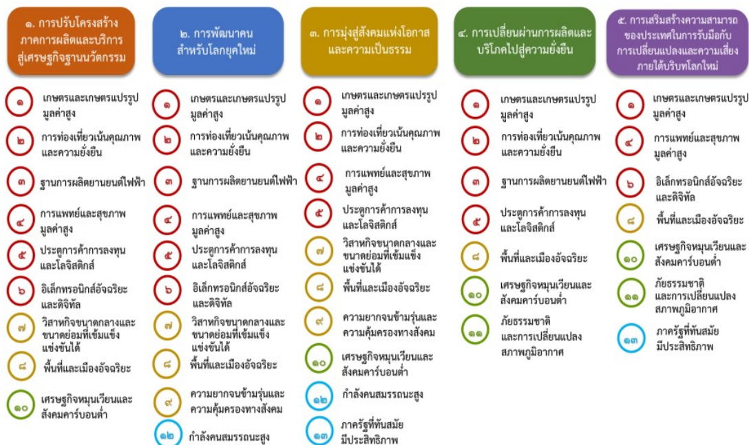
แผนภาพที่ ๓.๑ ความเชื่อมโยงระหว่างหมวดหมู่การพัฒนากับเป้าหมายหลัก

ความเชื่อมโยงระหว่างหมวดหมู่การพัฒนากับเป้าหมายหลักแสดงไว้ในแผนภาพที่ ๓.๑ โดยหมวดหมู่ การพัฒนาที่กำหนดขึ้นเป็นประเด็นที่มีลักษณะเชิงบูรณาการที่ครอบคลุมการพัฒนาตั้งแต่ในระดับต้นน้ำจนถึง ปลายน้ำ และสามารถนำไปสู่ผลพัฒนาทั้งในมิติเศรษฐกิจ สังคม ทรัพยากรธรรมชาติและสิ่งแวดล้อมไปพร้อมๆ กัน ทำให้หมวดหมู่แต่ละประการสามารถสนับสนุนเป้าหมายหลักได้มากกว่าหนึ่งข้อ นอกจากนี้การพัฒนาภายใต้ แต่ละหมวดหมู่ไม่ได้แยกขาดจากกัน แต่มีการสนับสนุนหรือเอื้อประโยชน์ซึ่งกันและกัน