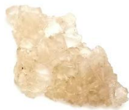
นี่แซชากา