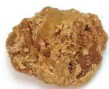
นี่แซพูเต๊ะ