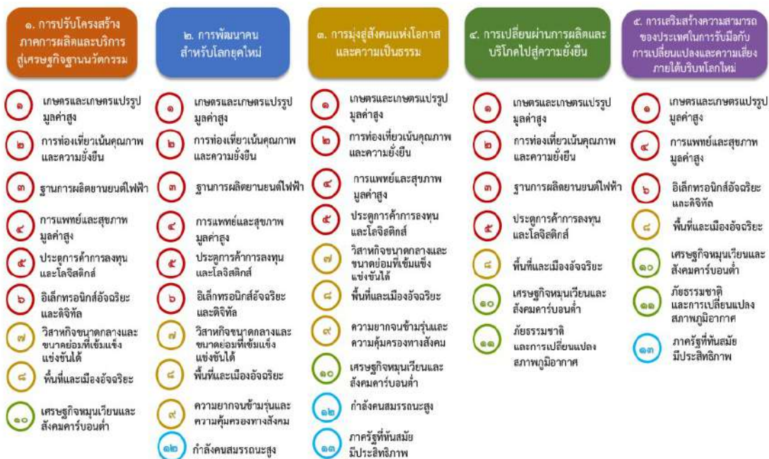
แผนภาพที่ ๓.๑ ความเชื่อมโยงระหว่างหมวดหมู่การพัฒนากับเป้าหมายหลัก

ความเชื่อมโยงระหว่างหมวดหมู่การพัฒนากับเป้าหมายหลักแสดงไว้ในแผนภาพที่ ๓.๑ โดยหมวดหมู่ การพัฒนาที่กำหนดขึ้นเป็นประเด็นที่มีลักษณะเชิงบูรณาการที่ครอบคลุมการพัฒนาตั้งแต่ในระดับต้นน้ำจนถึง ปลายน้ำ และสามารถนำไปสู่ผลพัฒนาทั้งในมิติเศรษฐกิจ สังคม ทรัพยากรธรรมชาติและสิ่งแวดล้อมไปพร้อมๆ กัน ทำให้หมวดหมู่แต่ละประการสามารถสนับสนุนเป้าหมายหลักได้มากกว่าหนึ่งข้อ นอกจากนี้การพัฒนาภายใต้ แต่ละหมวดหมู่ไม่ได้แยกขาดจากกัน แต่มีการสนับสนุนหรือเอื้อประโยชน์ซึ่งกันและกัน